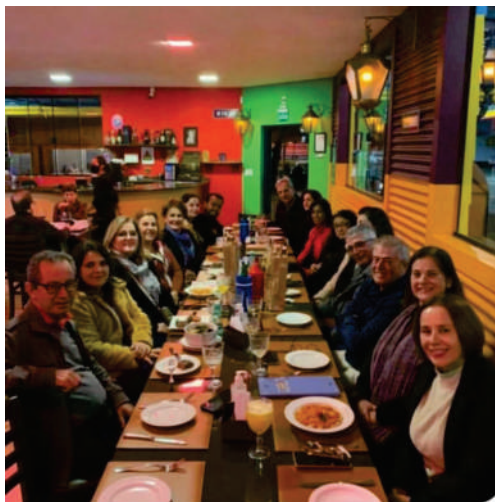
Egressos das turmas de 1983 e 1998