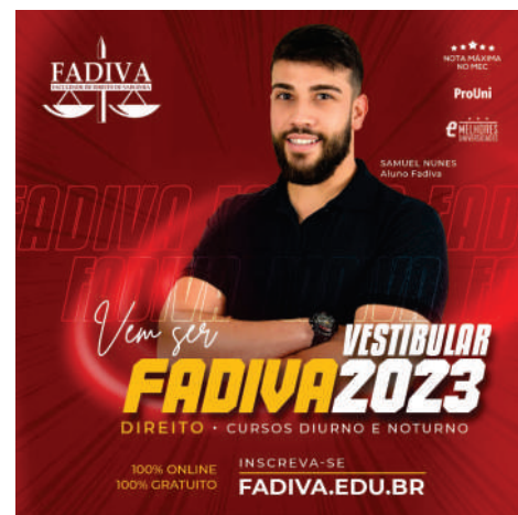
A Faculdade de Direito de Varginha deu início ao "Vestibular FADIVA