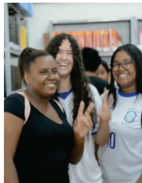
Visita da Escola Estadual Pedro de Alcântara à FADIVA. Foi um prazer recebê-los!