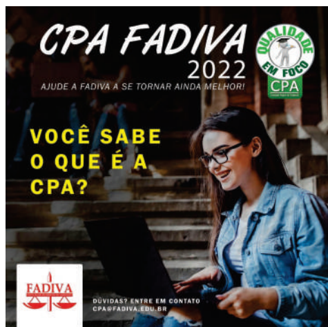
CPA FADIVA 2022