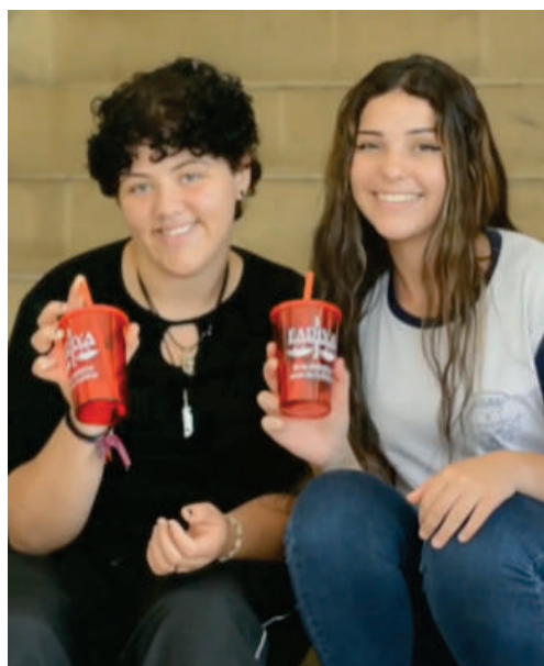
Visita da Escola Estadual Pedro de Alcântara à FADIVA. Foi um prazer recebê-los!