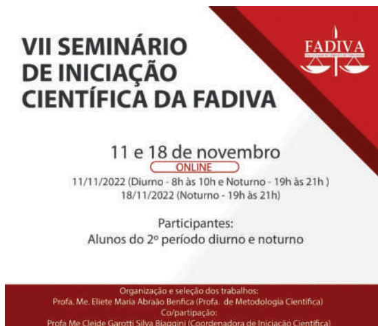
VII Seminário de Iniciação Científica da Fadiva